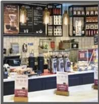
Mile Tea Store