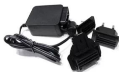
3 in 1 Adapter

Note: Please contact with the sales if you need any of these accessories.