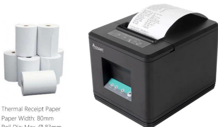
Thermal Receipt Paper Paper Width: 80mm Roll Dia: Max. Ø 83mm

Without the printing ink and ribbon etc traditional consumables, Low material cost