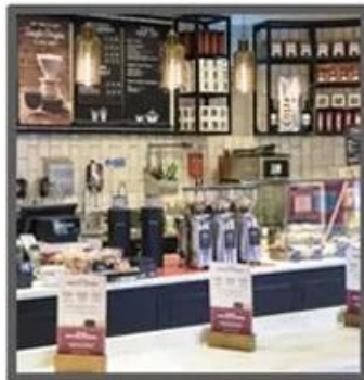
Mile Tea Store