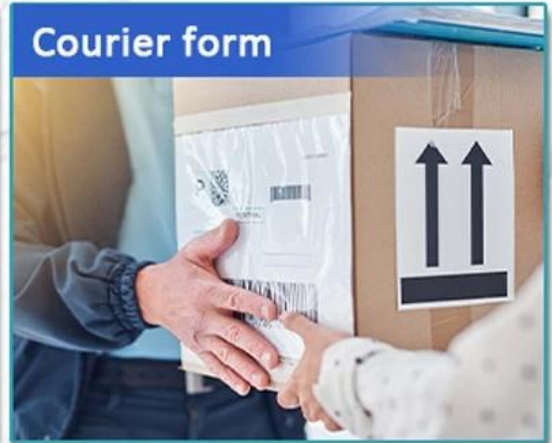
Warehouse Label Printing