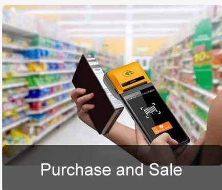
Purchase and Sale