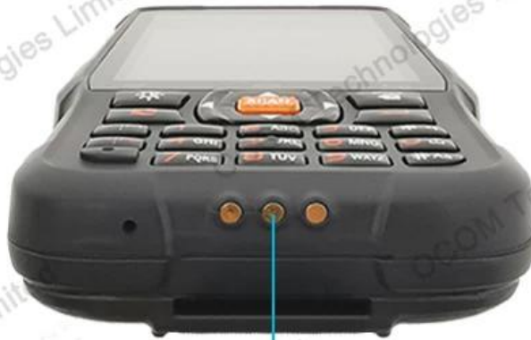
POGO PIN Interface

Professional POGO PIN interface, fast charging, reduce the loss of batteries and mainframe at the same time.